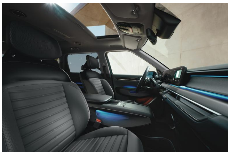
Wersja Earth wnętrze RBQ, opcja CP1