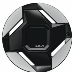
19" felgi aluminiowe (Earth)