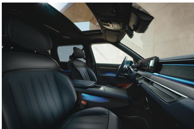
Wersja GT-Line wnętrze NJR