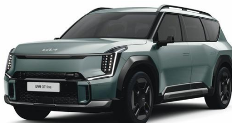
Iceberg Green (IEG) metalizowany