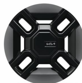
21" felgi aluminiowe (GT-Line)