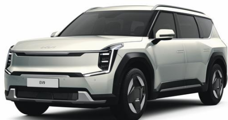
Ivory Silver (ISG) metalizowany, nieдоступny dla GT-Line