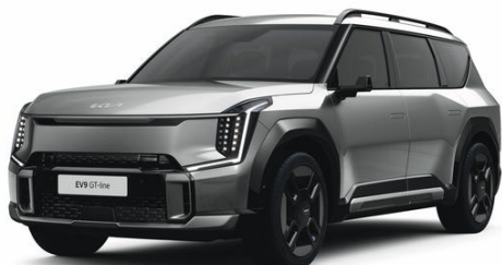
Pebble Grey (DFG) metalizowany