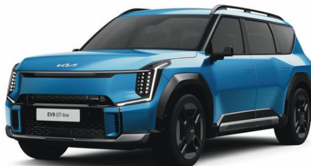
Ocean Blue (OBG) metalizowany, nieдоступny dla Earth