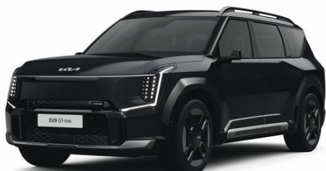
Aurora Black (ABP) metalizowany