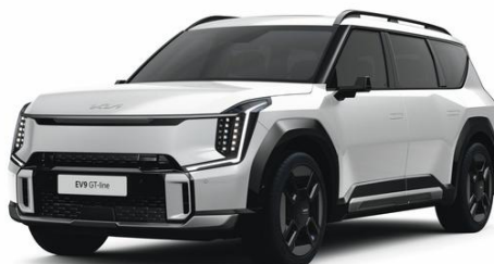
Snow White (SWP) metalizowany