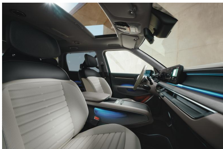
Wersja Earth wnętrze EMA, opcja CP1