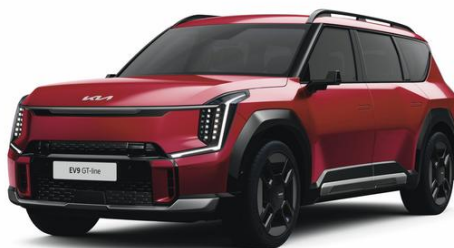
Flare Red (C7R) metalizowany, nieдоступny z tapicerką NJR, lakier bez dopłaty