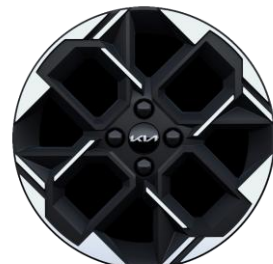
GT Line : 16" aluminiowe obrubcze kół z oponami w rozmiarze 195 / 45 R16