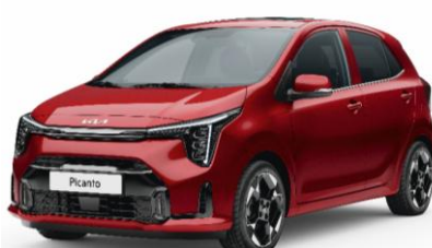
metalizowany Signal Red (BEG) antena dachowa w kolorze nadwozia