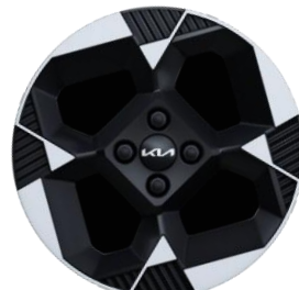
Business Line (opcja A16) 16" aluminiowe obręcze kół z oponami w rozmiarze 195 / 45 R16