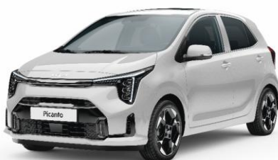
pastelowy Clear White (UD) antena dachowa czarna