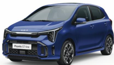
metalizowany Yacht Blue (DU3) antena dachowa czarna kolor dostępny od produkcji październikowej