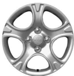
L : 14" stalowe obręcze kół z oponami w rozmiarze 175 / 65 R14