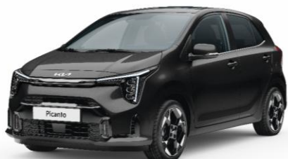
metalizowany Aurora Black (ABP) antena dachowa czarna bezpłatny