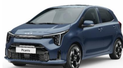
metalizowany Smoke Blue (EU3) antena dachowa czarna