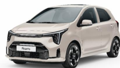
metalizowany Milky Beige (M9Y) antena dachowa w kolorze nadwozia