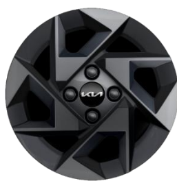
L (opcja A14) : 14" aluminiowe obrubcze kół z oponami w rozmiarze 175 / 65 R14