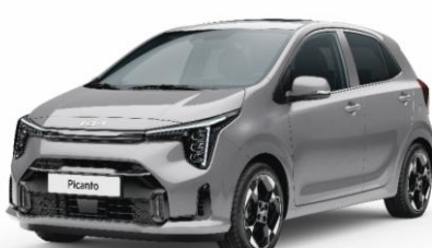
metalizowany Sparkling Silver (KCS) antena dachowa czarna