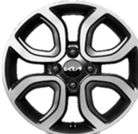
Business Line : 15" aluminiowe obrubcze kół z oponami w rozmiarze 185 / 55 R15