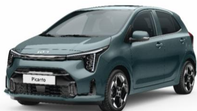
pastelowy Adventurous Green (A2G) antena dachowa w kolorze nadwozia