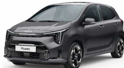
metalizowany Astro Grey (M7G) antena dachowa czarna