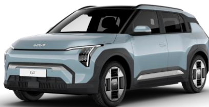
Frost Blue (EBB) pastelowy