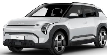
Snow White (SWP) metalizowany