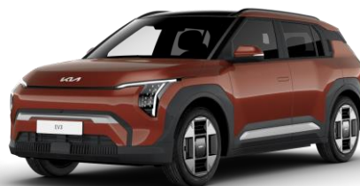
Terra Cotta (TCT) metalizowany bez dopłaty