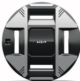
19" felgi aluminiowe Business Line