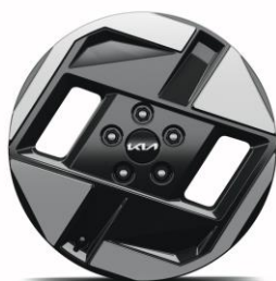
17" felgi aluminiowe Air i Earth