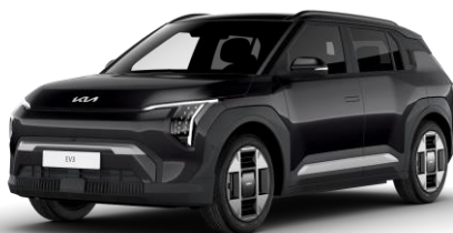
Aurora Black (ABP) metalizowany