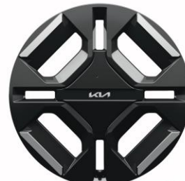
19" felgi aluminiowe GT Line