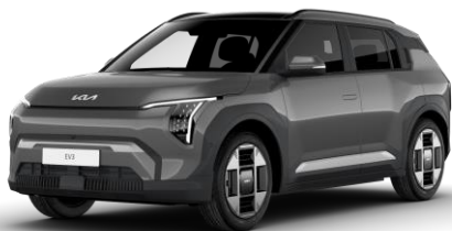
Shale Grey (EBD) metalizowany