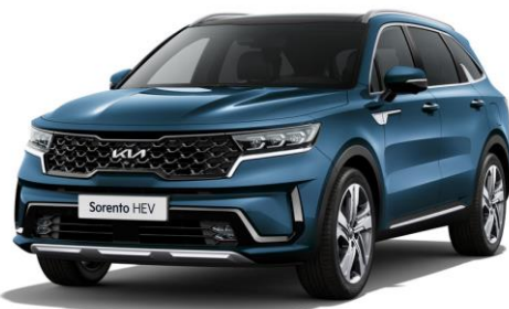
Mineral Blue (M4B)