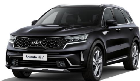
Aurora Black Pearl (ABP)