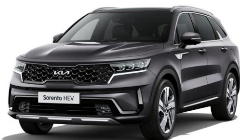
Platinum Graphite (ABT)