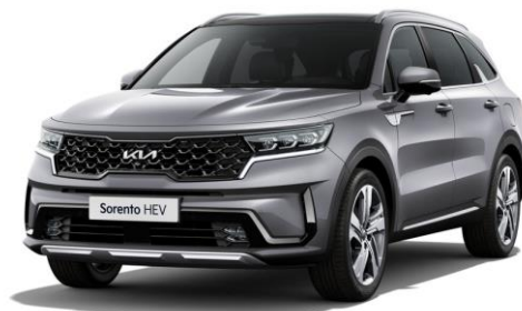
Steel Gray (KLG)