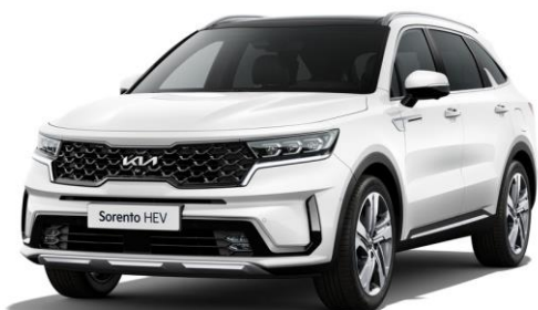
Snow White Pearl (SWP)