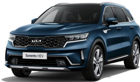
Gravity Blue (B4U)