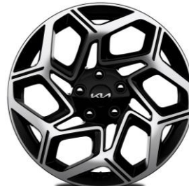
18-calowe felgi aluminiowe, wersja GT-Line