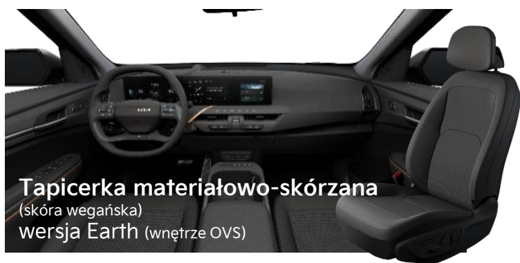
Tapicerka materiałowo-skórzana (skóra wegańska) wersja Earth (wnętrze OVS)