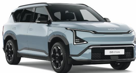
Frost Blue (EBB) lakier pastelowy bez dopłaty