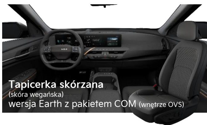
Tapicerka skórzana (skóra wegańska) wersja Earth z pakietem COM (wnętrze OVS)