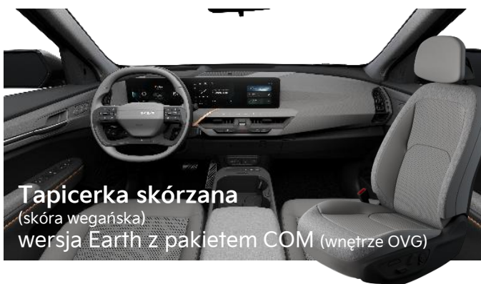
Tapicerka skórzana (skóra wegańska) wersja Earth z pakietem COM (wnętrze OVG)