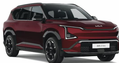
Magma Red (OVR) lakier perłowy