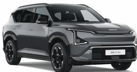
Gravity Grey (KDG) lakier metalizowany perłowy