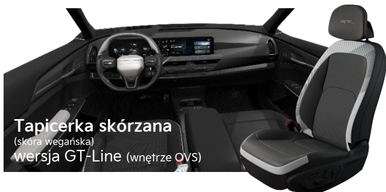
Tapicerka skórzana (skóra wegańska) wersja GT-Line (wnętrze OVS)