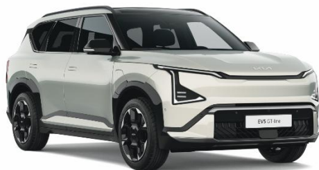
Ivory Silver (ISG) lakier metalizowany