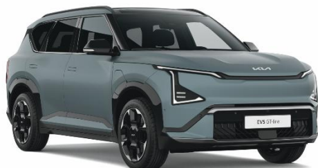
Iceberg Green (IEB) lakier matowy nieдоступny dla wersji Air