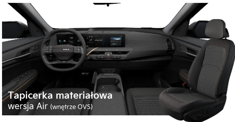
Tapicerka materiałowa wersja Air (wnętrze OVS)