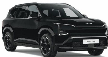
Fusion Black (FSB) lakier metalizowany perłowy