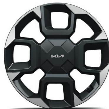
19" felgi aluminiowe, wersja GT-Line