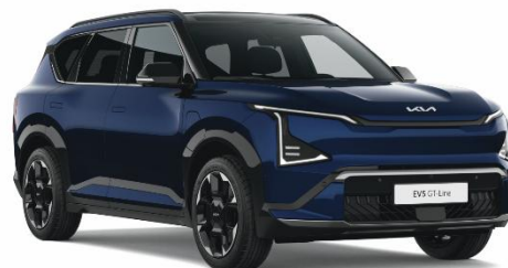
Dark Ocean Blue (BU3) lakier perłowy