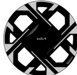
18-calowe felgi aluminiowe, wersja L oraz Business Line