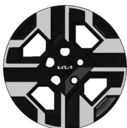
16-calowe felgi aluminiowe, wersja M