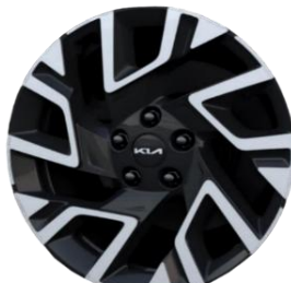
18-calowe felgi aluminiowe, wersja M + A18